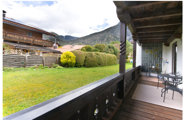
Terasse hinten 1