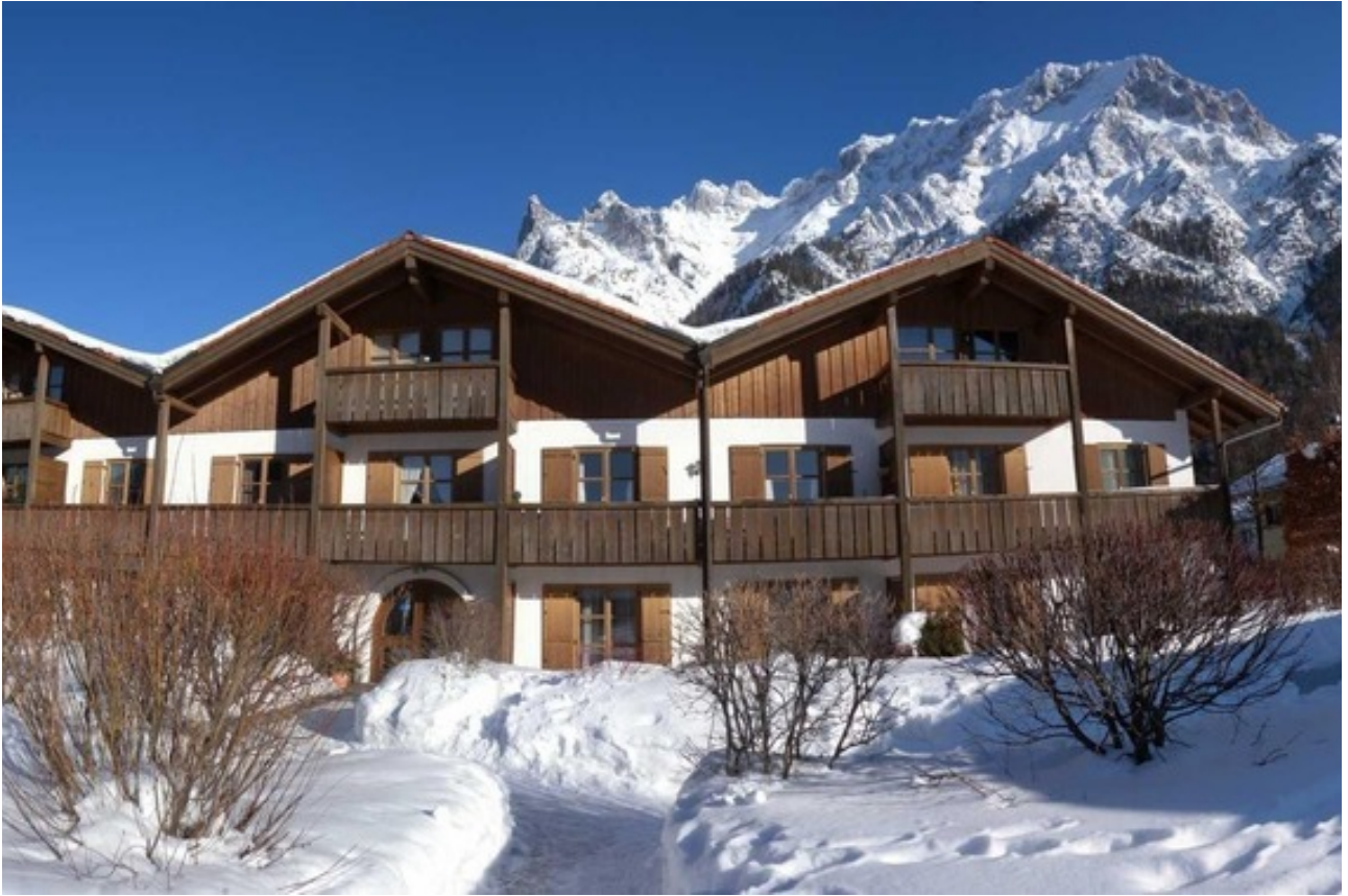
Haus 2 Vorderansicht