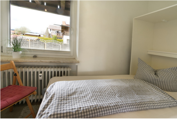
Gästebett in Kammer