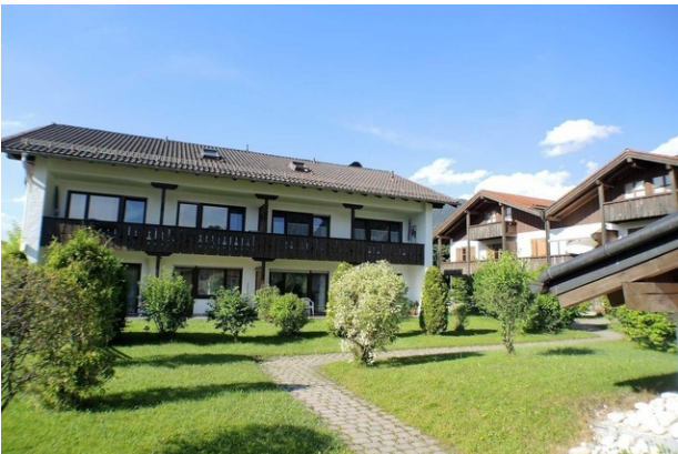
Haus 1 Vorderansicht