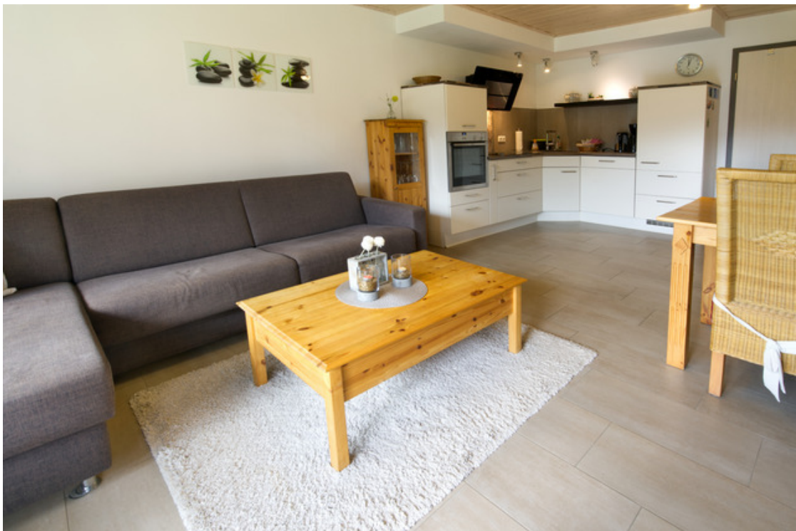
Wohn und Küchenbereich